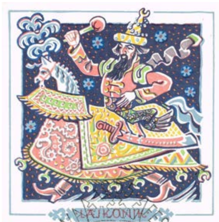
Witold Chomicz, kartka pocztowa wydana z okazji Dni Krakowa, 1955

więcej na: https://www.facebook.com/pochodlajkonika/about