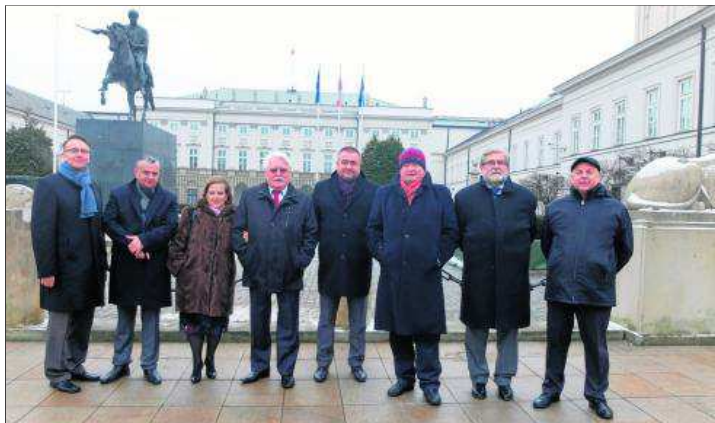
Delegacja Krakowskiej Kongregacji Kupieckiej przed Pałacem Prezydenckim