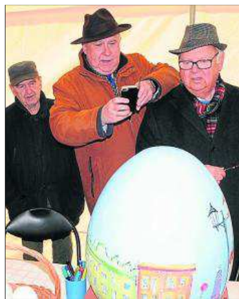
Malowanie pisanek przez krakowskich VIP-ów