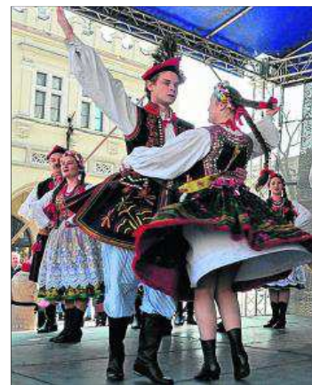
Zespoły regionalne na estradzie Targów