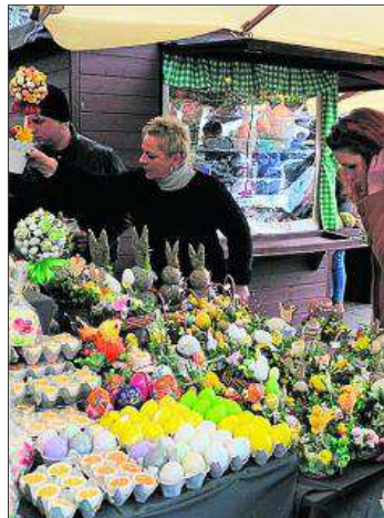
Jajka wielkanocne wszechobecne na straganach