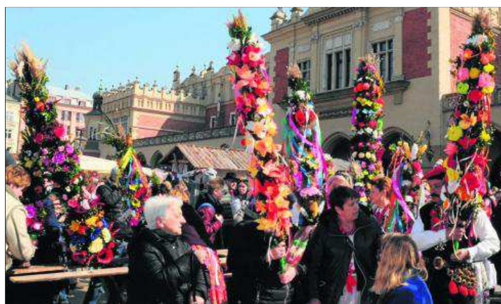
Konkurs najpiękniejszych palm wielkanocnych – przyjmowanie zgłoszeń