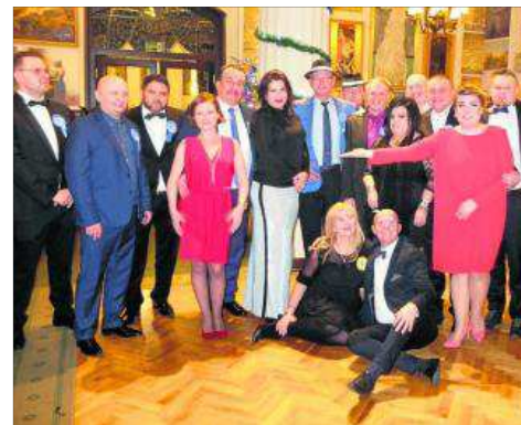
Kupcy z Sukiennic stanowili najbardziej rozbawioną grupę

Na rozpoczęcie balu przybył prezydent Krakowa Jacek Majchrowski. W trakcie zabawy dołączył też wicemarszałek województwa małopolskiego Woj-