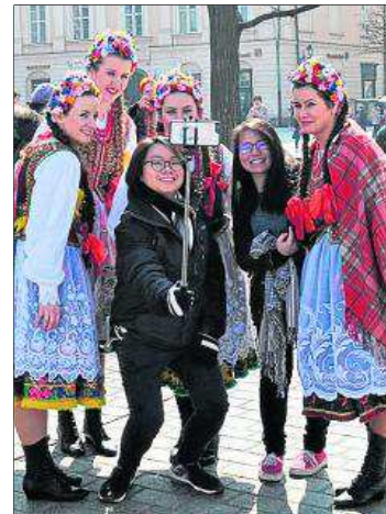
Turystki z Dalekiego Wschodu i krakowianki