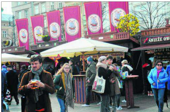
Nad Targami Wielkanocnymi powiewają flagi działającej od 608 lat Krakowskiej Kongregacji Kupieckiej