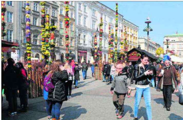
Wjeście na Targi Wielkanocne tradycyjnie zdobią największe palmy w Ryнку Głównym